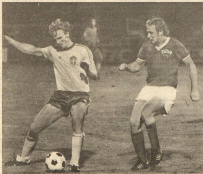
Dem schnellen, angriffsfreudigen Wendt kaufte Kische sofort den Schneid ab. Schwedens Hoffnungen, über den Linksaußen Gefahr zu erreichen, erfüllten sich so nicht.

Klaus Schlegel: Schwedisches Lob für unseren Fußball richtig einordnen ● Das Hinwenden zur angriffsorientierten Spielweise aus sicherer Deckung weiter ausbauen ● Stoßstürmer müssen durchschlagskräftiger werden