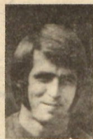
Im Urteil der Kapitäne

Zum Schiedsrichterkollektiv: Das widerliche In-die-Beine-Gehen in drei Fällen ahndete Kulicke mit Verwarungen. In einigen schlecht überschaubaren Situationen wußte er aufmerksame Linienrichter an den Seiten.